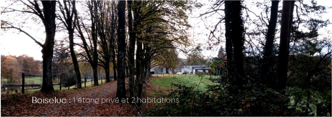
Boiseluc : 1 étang privé et 2 habitations