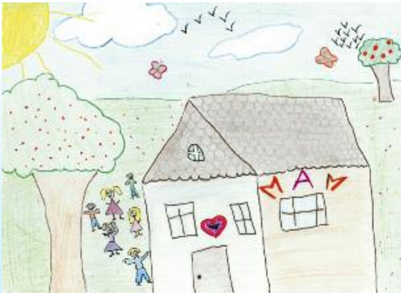
Maison d'Accueil Maternelle